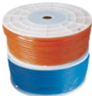
Внешний вид при поставке бухтой