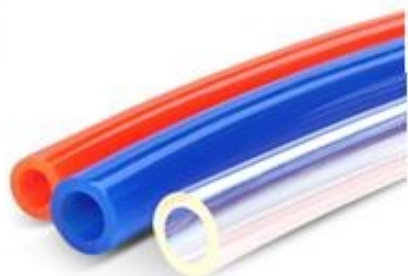
Внешний вид трубки серия PU

Трубка полимерная серия PU предназначена для подачи сжатого воздуха к различным пневматическим элементам, монтаж с использованием фитингов. Выполнена из материала полиуретан, который обладает прекрасной гибкостью (эластичностью) и стойкостью. Рабочее давление 8 бар, максимальное давление на разрыв 24 бар. Цвет синий. Трубка имеет калиброванные размеры наружного и внутренних диаметров с допуском ±0.1 мм. Температура эксплуатации: -20°C...+70°C.